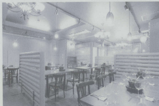
内装に県産木材を使用した暖かみのあるレストラン

施設では、山梨県が定めた基準に沿って感染症対策を行っているので、安心してご来店いただけます。