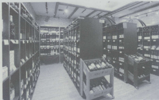
県産酒を常時300種類以上取りそろえる物販スペース

※新型コロナ対策のため、営業時間が変更になる場合がありますので、店舗にご確認ください。