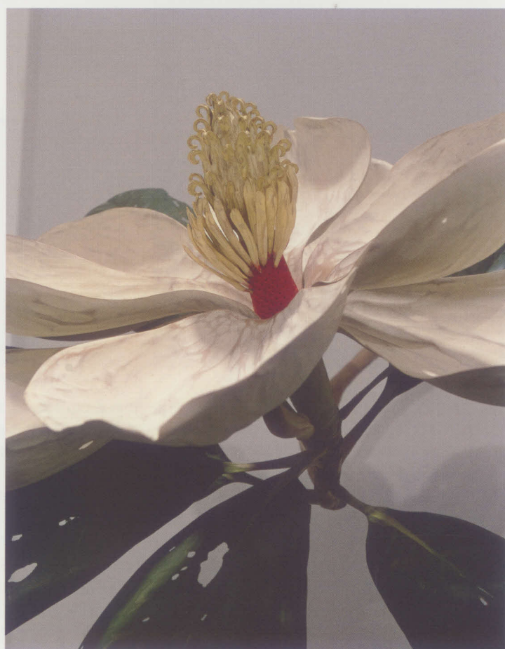
須田悦弘 (泰山木:花) 千葉市美術館蔵