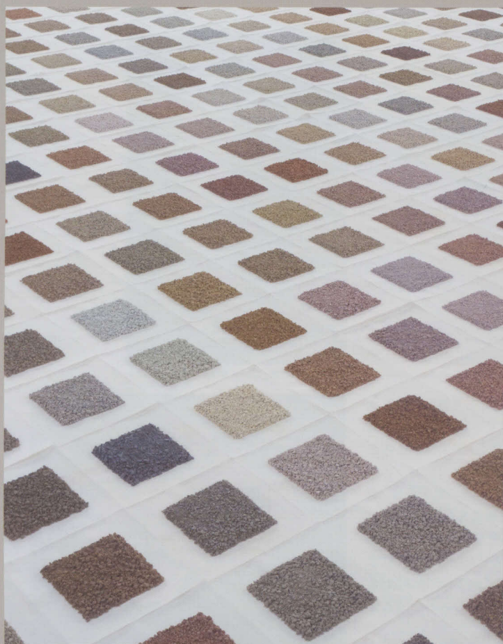
栗田宏一 (soil library)