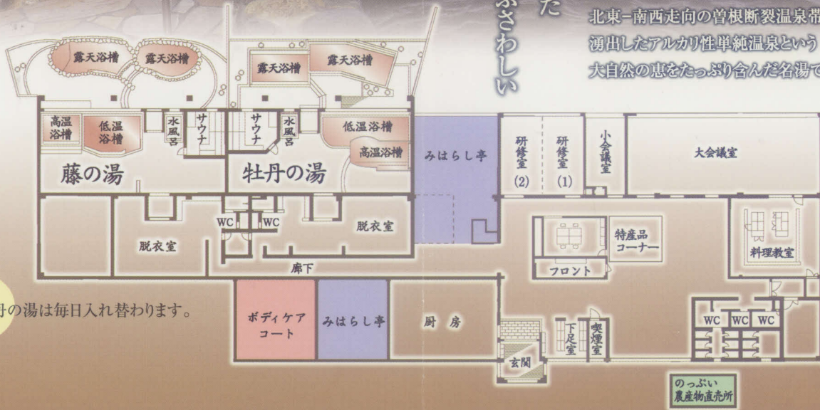
藤の湯と牡丹の湯は毎日入れ替わります。

世界的に貴重な特異地形である「甲府大三角形構造盆地」の東南端、北東-南西走向の曾根断裂温泉帯から湧出したアルカリ性単純温泉という大自然の恵をたっぷり含んだ名湯です。