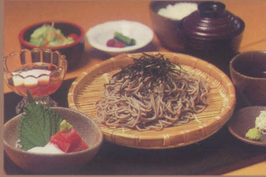
料理長おすすめ、そば御膳