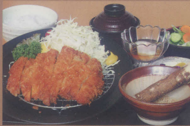
人気です、とんかつ定食