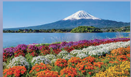
四季折々の花が咲く花街道