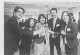
懇親会のひとコマ

十士会の活動実績、個々の会員の詳しい情報等は、十士会ホームページをご覧ください。