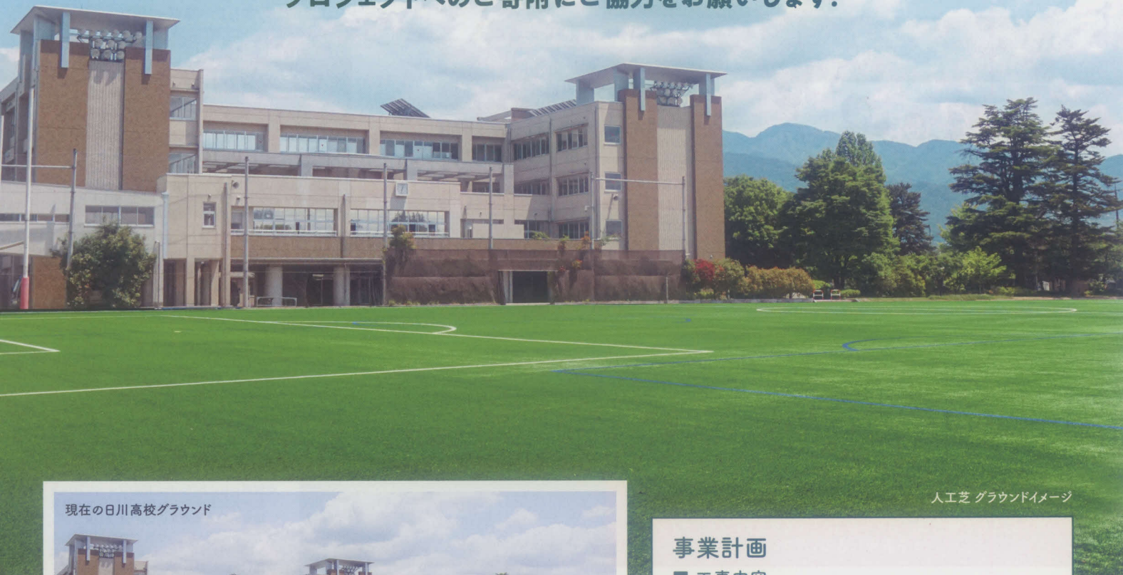
現在の日川高校グラウンド