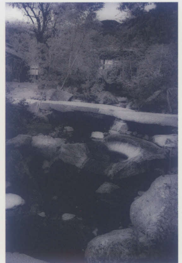
曲水借景の庭