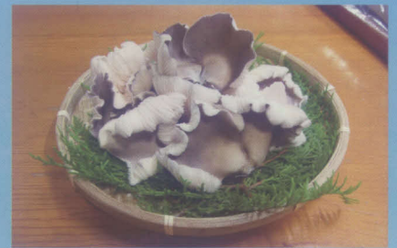
山梨のブランドきのこ「山梨夏っ子のこ(クロアワビタケ)」

に惹かれてやってきましたが、ここは別世界。静謐な環境に癒される日々で、早く来ればよかったと思っています。