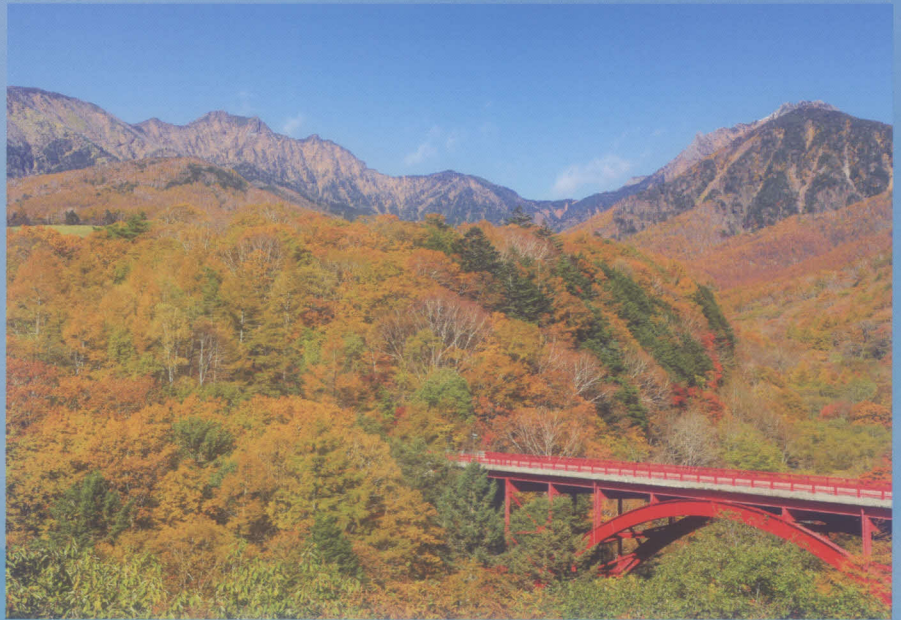
山梨の名水を生み出す山嶺「八ヶ岳」