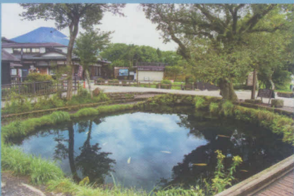
富士山の伏流水が水源の「忍野八海」