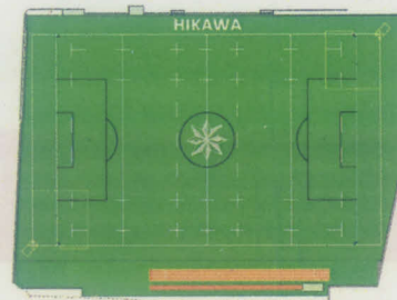
グラウンドレイアウト (イメージ)