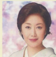
伍代夏子 (ソニーミュージック歌手)