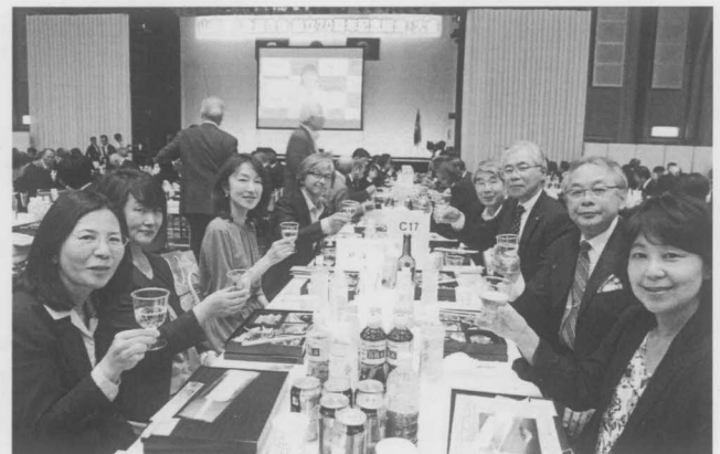
記念総会・大会の参加者は 2800 名、十士会からも 30 名が参加して、資料配布などをしました