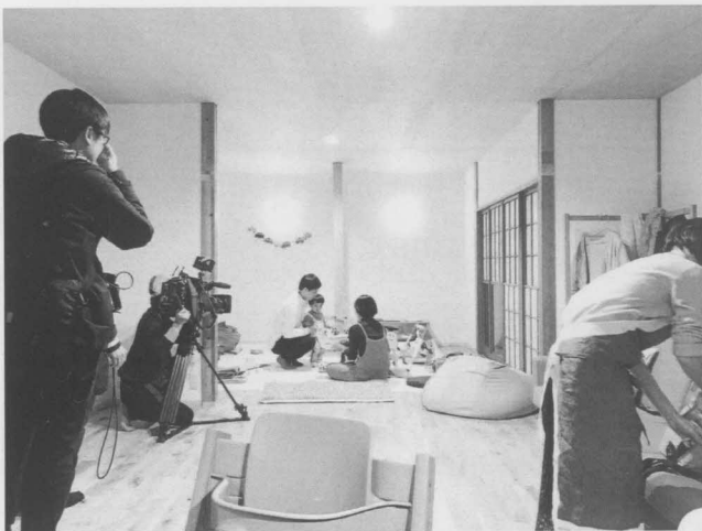
テレビドキュメンタリーの撮影風景