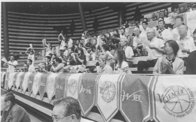
クィーンビーズの応援団

今回初参加させて頂き、彼女たちの勝利への執念を強く感じましたので、今年のWリーグは今までと異なる結果となるのではないかと感じました。バスケットボールについて馴染みが薄いですが、今後も応援したいと思います。