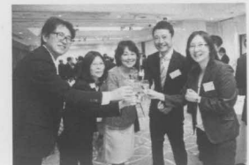
懇親会のひとコマ

十士会の活動実績、個々の会員の詳しい情報等は、十士会ホームページをご覧ください。