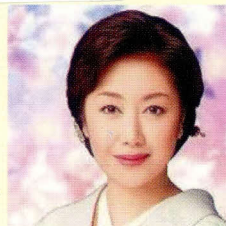
伍代夏子 (ソニーミュージック歌手)